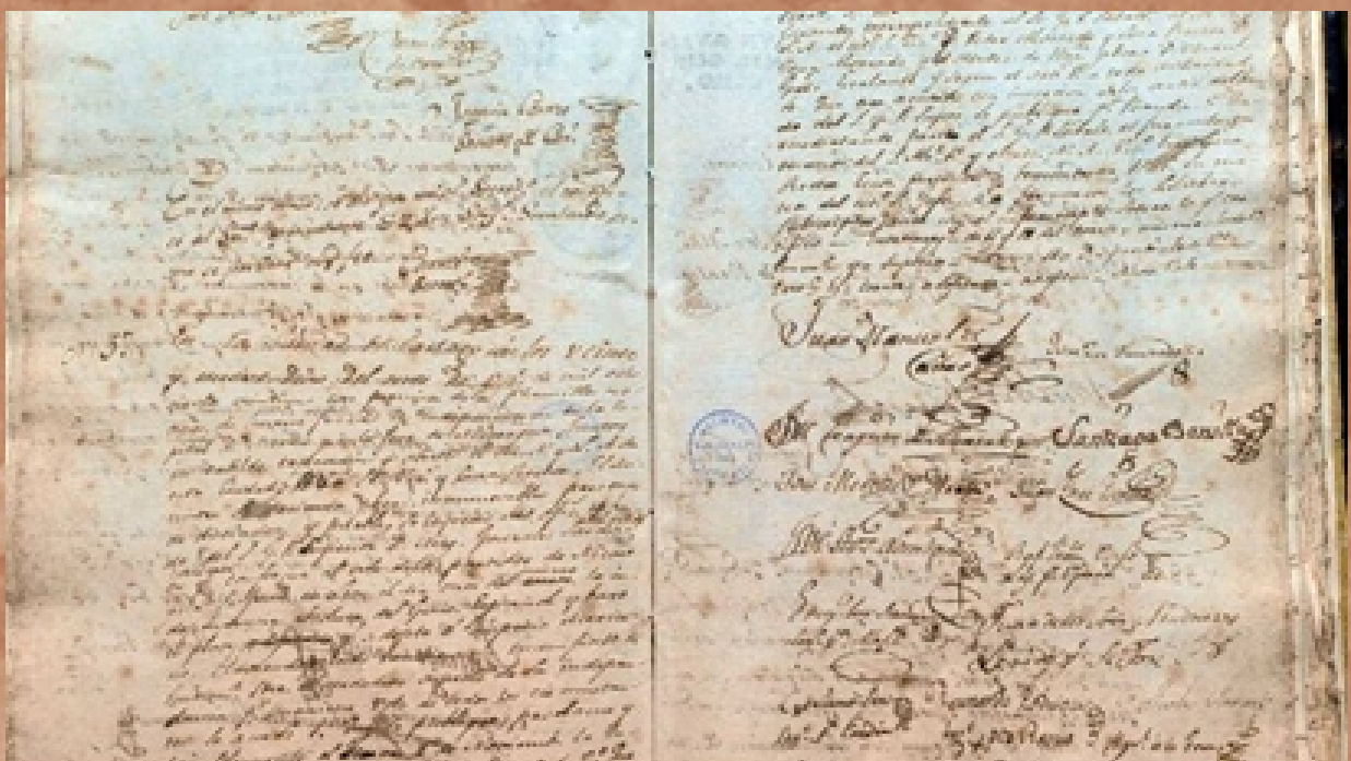
Acta de Independencia, tomada de Revista de Costa Rica (1921, página 8)

Explicar las particularidades de la independencia de Costa Rica, respecto a otros países.