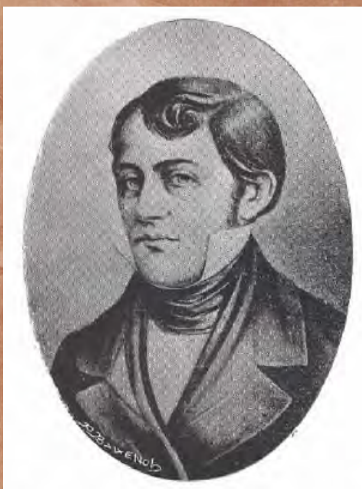
Juan Mora Fernández.

Posteriormente, con la asimilación de la independencia, el Ayuntamiento de San José propone realizar en Cartago una reunión de delegados de los principales pueblos de Costa Rica para establecer una organización definitiva del Estado, por lo que, el 12 de noviembre de 1821, de esa reunión se constituyó una Junta Provisional Electoral a cargo del presbítero Nicolás Carrillo, quienes redactaron el Pacto Social Fundamental Interino de Costa Rica. Meses más tarde, se elige la Primera Junta Superior Gubernativa a partir del 6 de enero de 1822, integrada por Rafael Barroeta quien asume la presidencia de esa junta, José María de Peralta (asume la presidencia de la junta el 15 de julio) y José Rafael de Gallegos (quien asume la presidencia de esa junta el 17 de octubre), Santiago Bonilla, José Mercedes de Peralta, Juan Mora Fernández y Joaquín Yglesias.